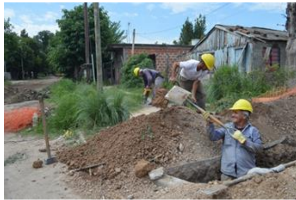
Tendido de redes.

Meta de Prioridad Nacional. Informe Voluntario Nacional 2017.